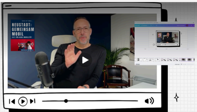
Selbstlernkurs für die FES KommunalAkademie: Öffentlichkeitsarbeit in der Kommunalpolitik